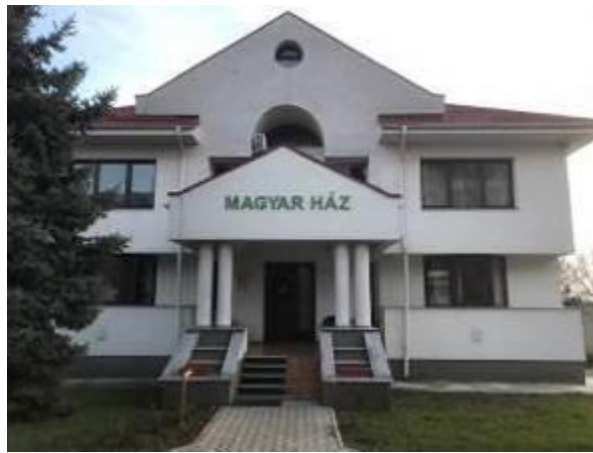
26. fotó: A Moldvai Csángómagyarok Szövetsége és a Moldvai Magyar Oktatási Központ székháza, a Magyar Ház Bákóban