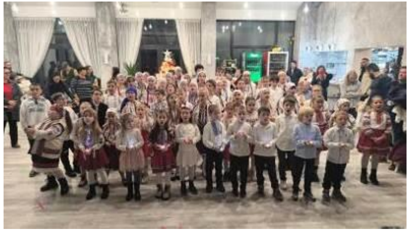
25. fotó: A nagyobbak pedig a lézpedi iskolában kapták meg az ajándécsomagokat