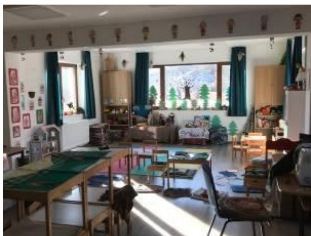
40. fotó: A csíkfalui „Magyar Ház” csángómagyar iskolájának egyik szépen berendezett és hangulatos osztályterme