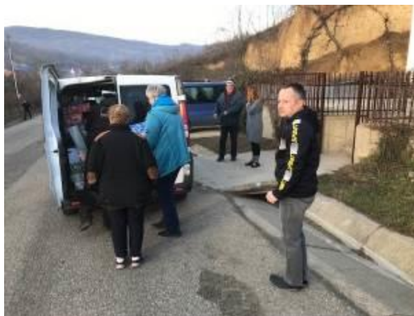
28. fotó: Bogdánfalvára érkeztek a karácsonyi ajándécsomagokat szállítók