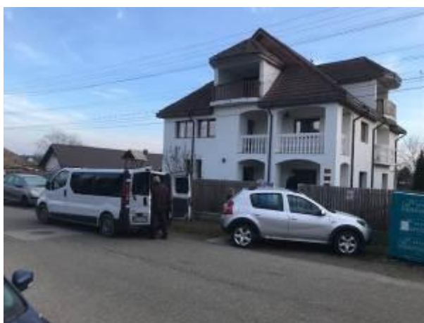
30. fotó: Ferdinandófalú „Magyar Ház” – a előtt karácsonyi ajándécsomagokat szállítók