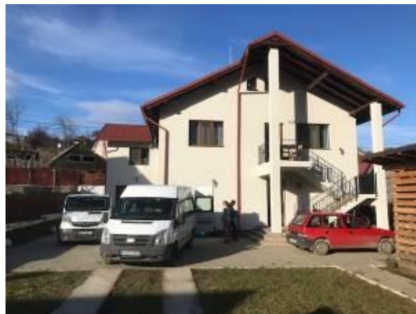
39. fotó: A karácsonyi adománycsomagokat szállító kisbuszokból Csíkfalú „Magyar Ház” – ának udvarán rakodják ki az ajándécsomagokat