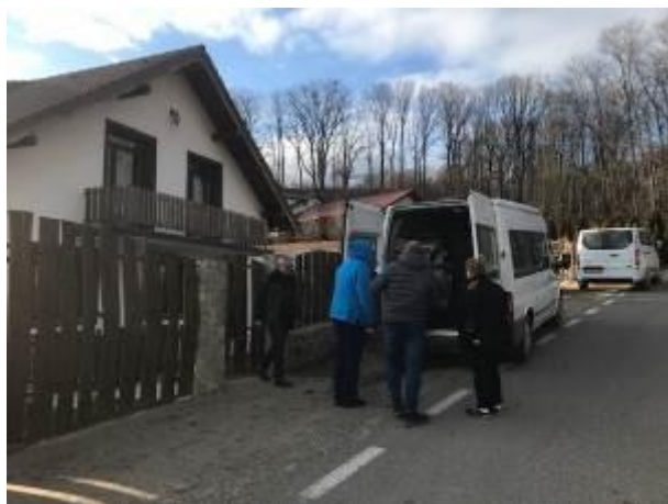
43. fotó: A karácsonyi ajándécsomagok kirakodása Dumbravén „Magyar Háza” – a csángómagyar iskolaépületénél