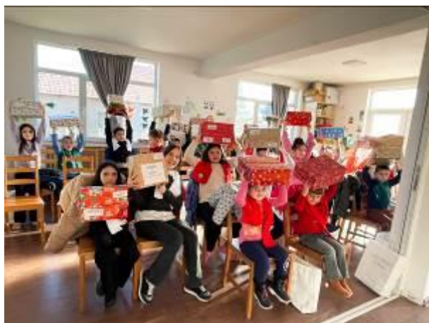
15. fotó: Itt is (Diószeg) nagy örömmel fogadták a csomagokat.