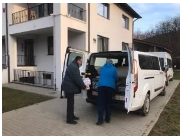
45. fotó: A karácsonyi ajándécsomagok kirakodása Szászkút település „Magyar Ház” – a csángómagyar iskolaépületénél