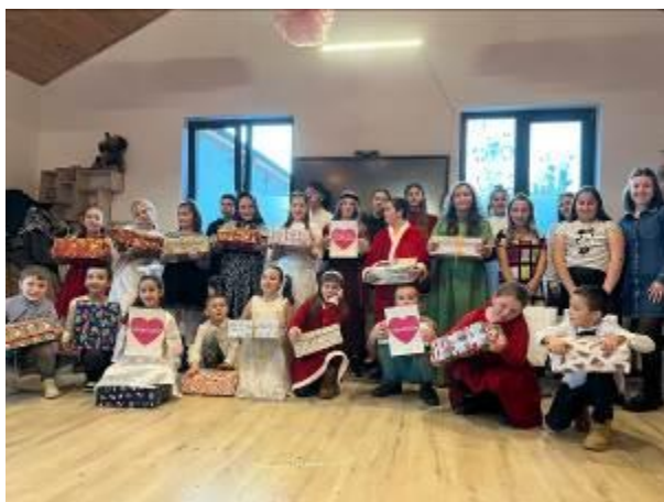
6. fotó: A karácsonyi ajándécsomagok a boldog „magyariskolásoknál”.