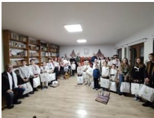
41. fotó: A karácsonyi ajándécsomagok kirakodása Külsőrekecsin „Magyar Háza” – a csángómagyar iskolájában és a megajándékozott gyermekek