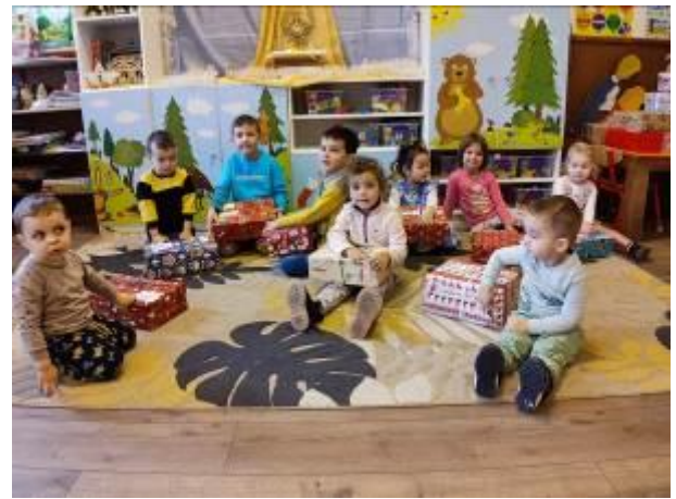
49. fotó: A karácsonyi ajándécsomagok a Gyimesbükk „Magyar Ház” csángómagyar iskolájában és már az ovisoknál