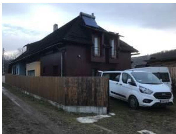
21. fotó: Pusztina moldvai település csángómagyar iskolájához érkeztek a karácsonyi ajándékcsomagokat szállító egri és nyíregyházi csoport gépjárművei