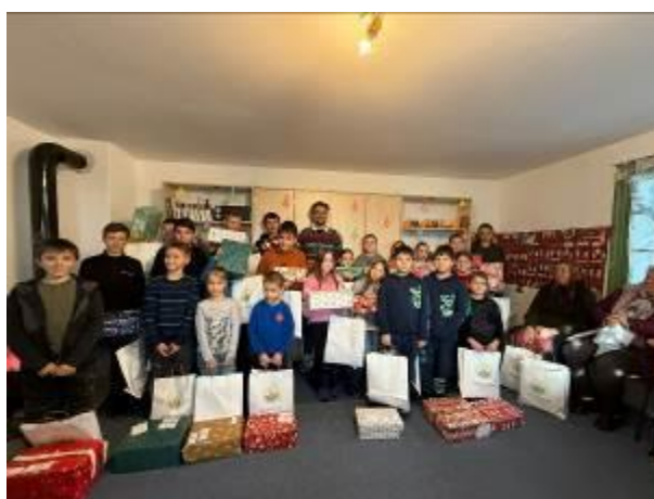
20. fotó: A lujzikalagori csángómagyar gyerekek is megkapták az ajándékokat