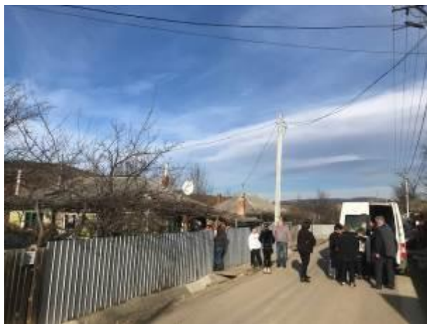
16. fotó: Gajdár moldvai csángómagyar iskolájához érkeztek a karácsonyi ajándécsomagok