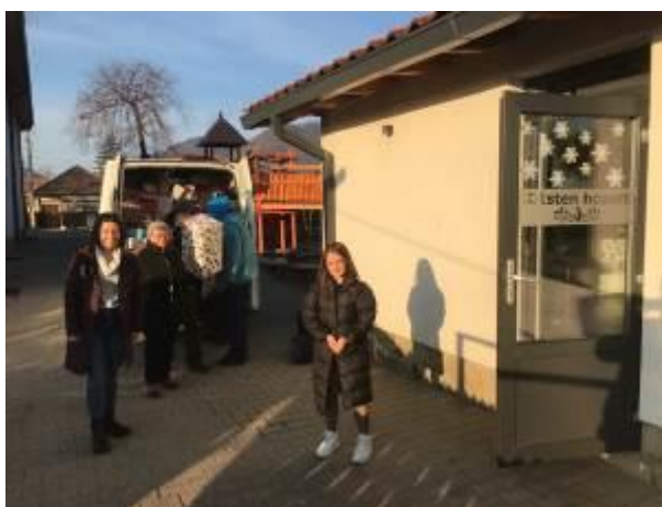
5. fotó: A karácsonyi ajándécsomagok kipakolása az egri csoport kisbuszából az itt dolgozó pedagógusokkal Ojtoz/Gorzafalván a „Magyar Ház” – ban működő iskolában