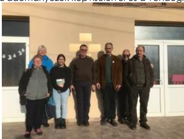
14. fotó: Az egri és a nyíregyházi csoport tagjai a diószegi csángómagyar iskola bejárata előtt az iskola pedagógusával