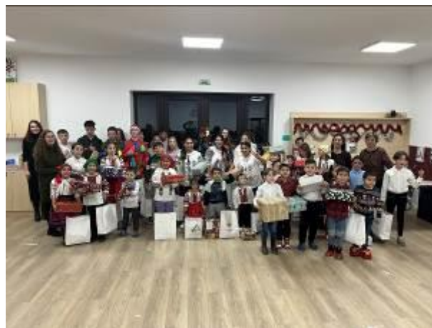
47. fotó: Diószén település „Magyar Háza” – ának csángómagyar iskolájában is nagy volt az öröm