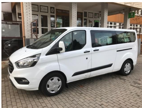
4. fotó: Nyíregyházán is