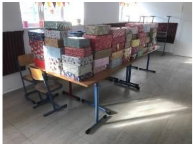
38. fotó: A karácsonyi ajándécsomagok átadásának következő állomásán, a moldvai Pokolpatak „Magyar Ház” – a csángómagyar iskolaépületénél/ben