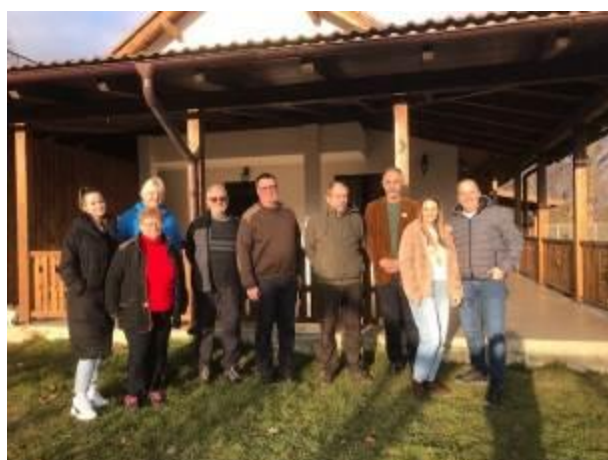
44. fotó: A karácsonyi ajándécsomagokat szállító egri és nyíregyházi csoport tagjai a vendéglátó magyar pedagógusokkal készült csoportkép