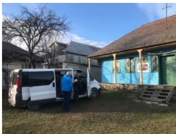
18. fotó: Lujzikalagor település csángómagyar iskolájába érkeznek a karácsonyi ajándécsomagok