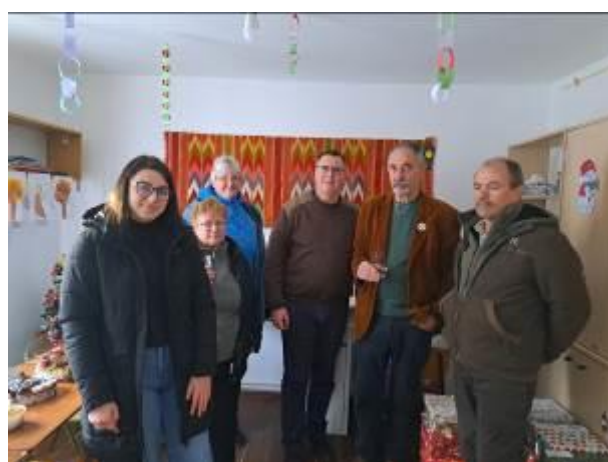
11. fotó: A karácsonyi ajándécsomagok kirakása az újfalusi iskolában és egy kis melegítő tea a bepakolás után.