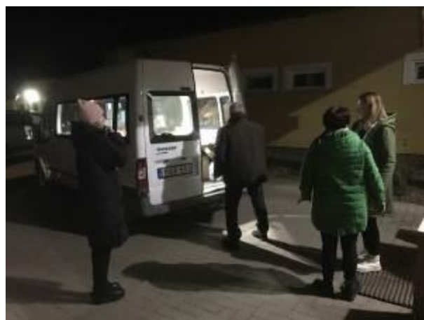
48. fotó: A karácsonyi adományokat szállítók útjuk utolsó moldvai/erdélyi állomására, Gyimesbükkre is már az esti időszakban érkeztek meg