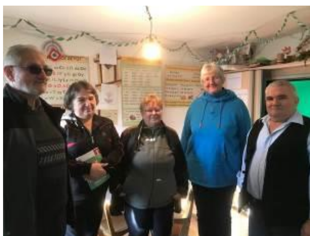
17. fotó: Az ajándécsomagokat szállító képviselők az iskola két pedagógusával az iskola egyik osztálytermében