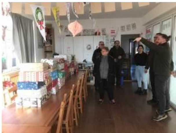
13. fotó: Diószeg település csángómagyar iskolájába érkezett karácsonyi ajándékcsomagok az adományozók képviselőivel és a vendéglátó pedagógusaikkal