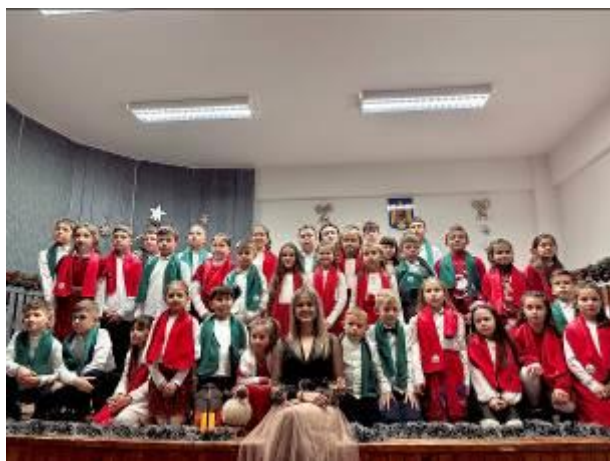
10. fotó: A szitási csángómagyar iskolában a csomagokra várakozva.