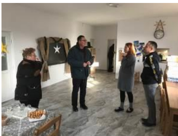
29. fotó: Az adományok fogadása és szakmai beszélgetés a bogdánfalvai csángómagyar iskola pedagógusaival