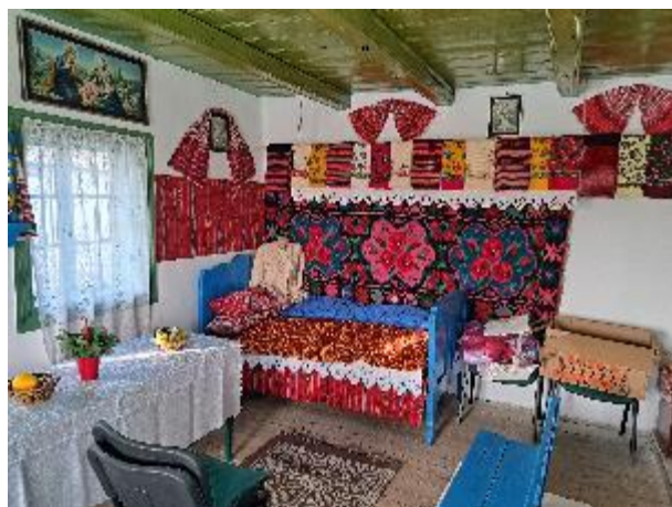
19. fotó: Az egri és a nyíregyházi csoport tagjai a lujzikalagori csángómagyar iskola bejárata előtt és egy hagyományos szobabelső a házból