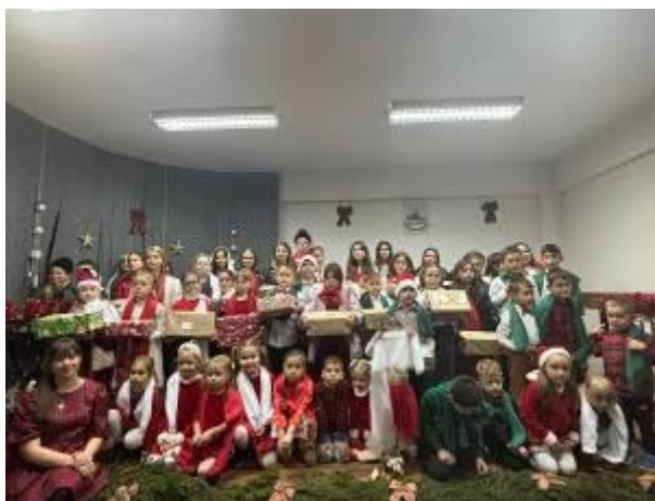
12. fotó: A csomagok már a fa alatt várakoztak, de hamar gazdára leltek.