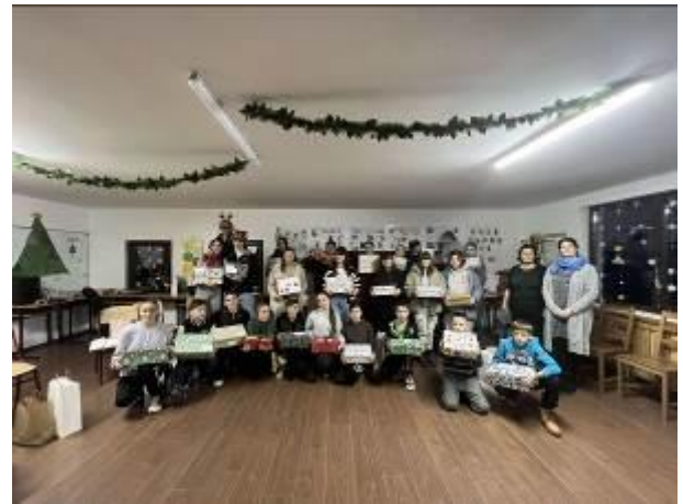
37. fotó: A karácsonyi műsor Somoskán, majd következett az ajándékok átvétele