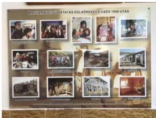
42. fotó: Egy, a magyar nyelvű oktatásról szóló képes tájékoztató az iskolaépület falán