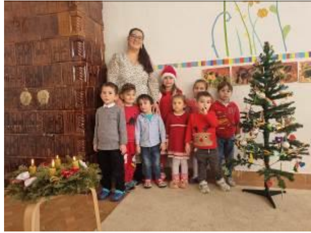
46. fotó: Trunk település „Magyar Háza” – ának csángómagyar iskolájában fogadják a karácsonyi ajándécsomagokat