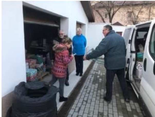
27. fotó: A karácsonyi ajándécsomagok kirakása a Magyar Ház udvarán